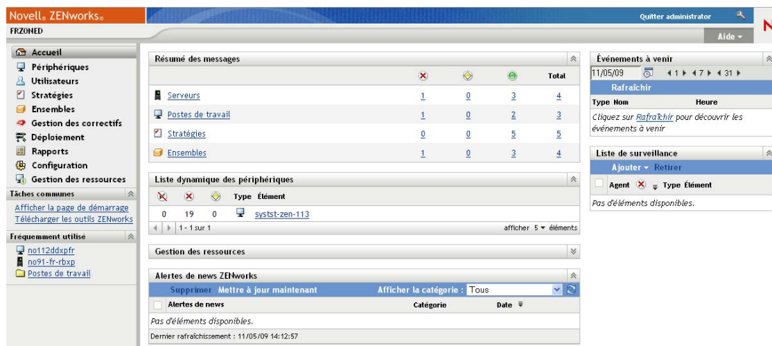
Figure 1-2 Centre de contrôle ZENworks

ZCC est installé sur tous les serveurs primaires de la zone de gestion. Vous pouvez effectuer toutes les tâches de gestion sur n'importe quel serveur primaire. Étant donné qu'il s'agit d'une console de gestion basée sur le Web, ZCC est accessible depuis n'importe quel poste de travail pris en charge .