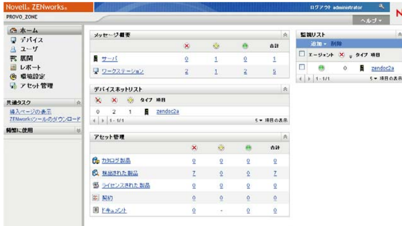
図 1-2 ZENworks コントロールセンター

ZCC は、管理ゾーンのすべてのプライマリサーバにインストールされます。どのプライマリサーバでも、すべての管理タスクを実行できます。Web ベースの管理コンソールであるため、ZCC はサポートされているワークステーションからアクセスできます。