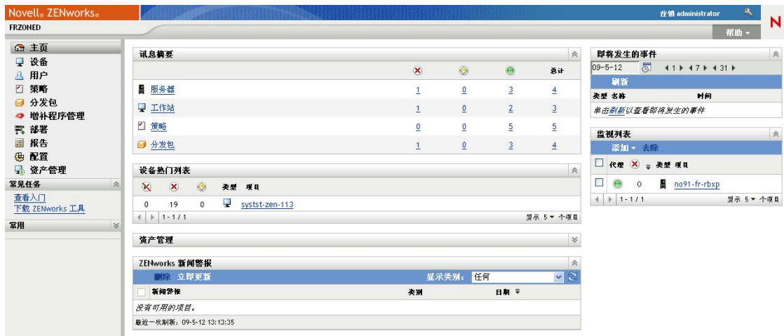
图 1-2 ZENworks 控制中心

ZCC 安装于“管理区域”中的所有“主服务器”上。您可以在任意一个“主服务器”上执行所有管理任务。由于 ZCC 是基于 Web 的管理控制台，因此可从任意支持的工作站对其进行访问。