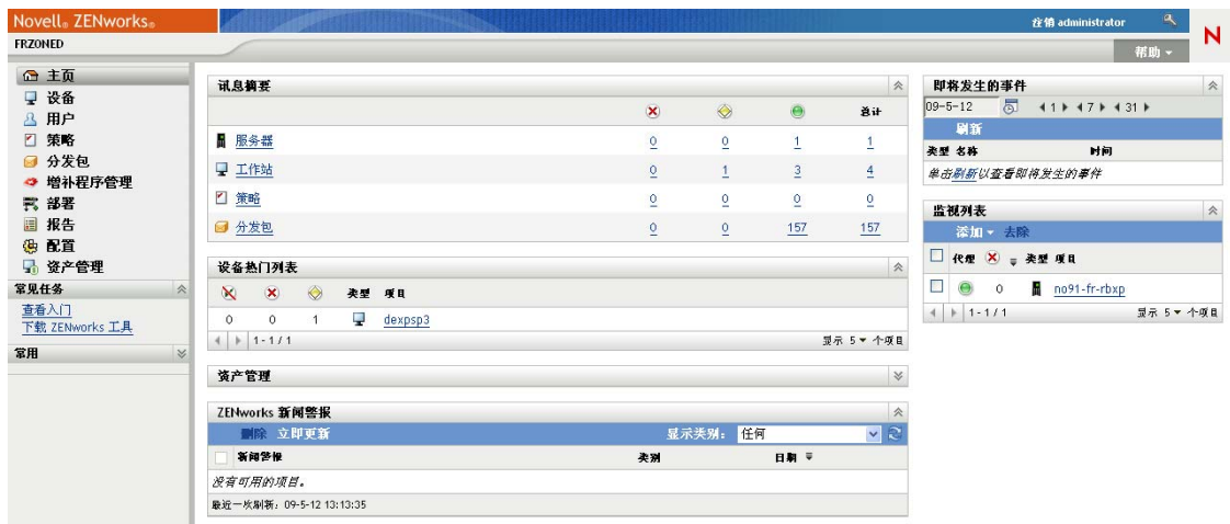
图 1-2 ZENworks 控制中心

ZCC 安装于“管理区域”中的所有“主服务器”上。您可以在任意一个“主服务器”上执行所有管理任务。由于 ZCC 是基于 Web 的管理控制台，因此可从任意支持的工作站对其进行访问。