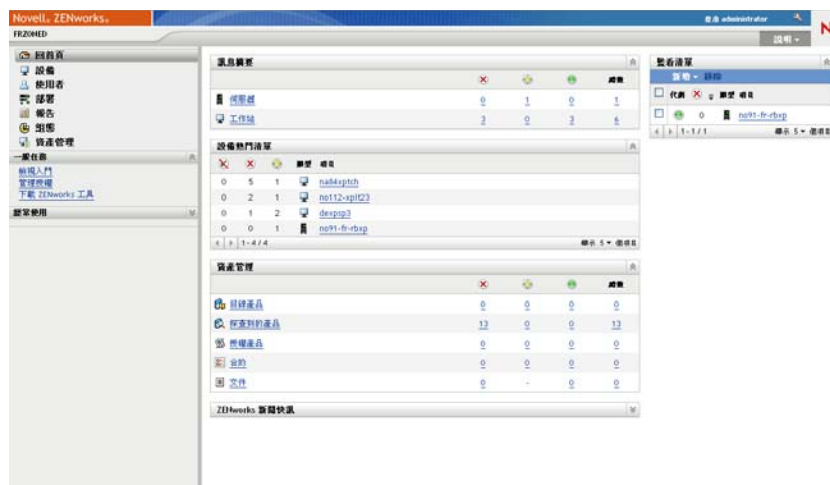
圖 1-2 ZENworks 控制中心

管理區內所有的主要伺服器皆會安裝 ZCC。您可以在任一部主要伺服器上執行所有的管理工作。由於 ZCC 屬於 Web 型管理主控台，因此您可以從任何受支援的工作站上加以存取。